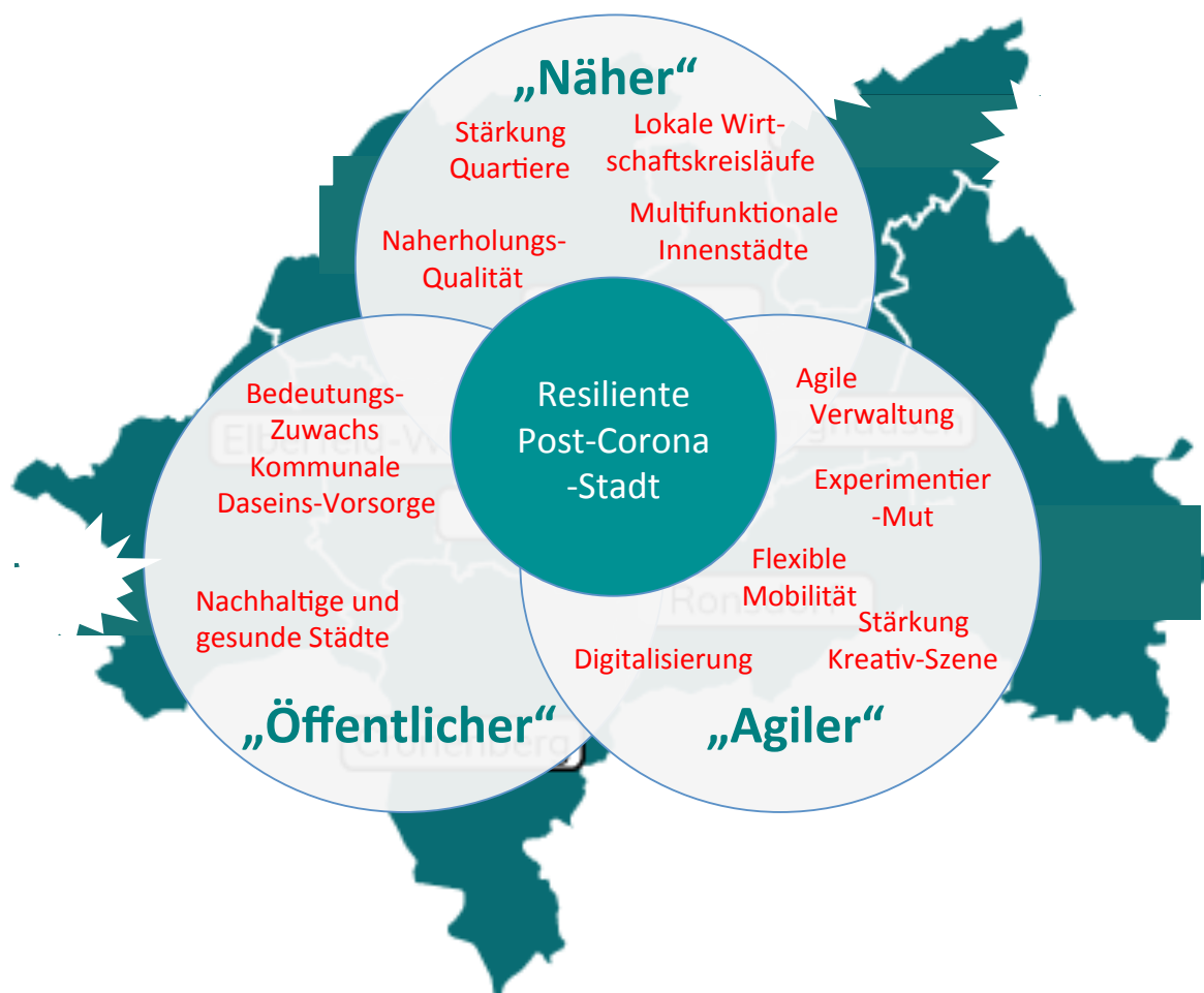
Abb. 1: Konturen einer resilienten Post-Corona-Stadt