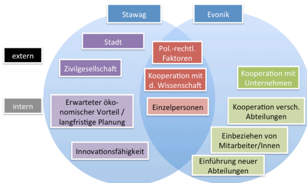
Abb. 1: Treiber der Transformation auf Unternehmensebene (eigene Darstellung)